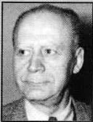
Lucian Blaga (1895–1961)

Info: Filosof și poet, născut la Lancrăm, în apropiere de Sebeș. Studiile filosofice le-a făcut la Universitatea din Viena, unde a obținut în anul 1920 titlul de doctor. În anul 1938 a fost numit profesor de filosofia culturii la Universitatea din Cluj-Napoca. În perioada 1949–1959 a lucrat la Filiala Cluj a Academiei și la Biblioteca universitară. Filosofia sa reprezintă o reflecție asupra condiției umane în univers, în fața Marelui Anonim, conceput ca un „produs mitic-filosofic” al imaginației căutătoare de sensuri ultime, căruia i se atribuie calități divine și demonice.