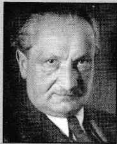
Martin Heidegger (1889–1976)

Acest om areligios descinde însă din homo religiosus și este, fie că vrea sau nu, opera acestuia, adică s-a constituit datorită unor stări asumate de strămoșii săi, fiind în cele din urmă rezultatul unui proces de desacralizare. Așa cum „Natura” este un produs al secularizării treptate a Cosmosului, lucrare a lui Dumnezeu, omul profan este rezultatul unei desacralizări a existenței umane. Aceasta înseamnă însă că omul areligios s-a constituit, spre