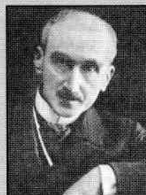
Henri-Louis Bergson (1859–1941)

În privința inteligenței omenești, încă nu s-a accentuat îndeajuns de mult asupra faptului că invenția mecanică a constituit punctul ei de plecare, că și astăzi viața noastră socială gravitează în jurul fabricării și utilizării instrumentelor artificiale, că invențiile care au marcat progresul au trasat, în același timp, însăși direcția acestuia. Adesea ne e greu să ne dăm seama că schimbările suferite de omenire se referă de obicei la transformările din domeniul uneltelor folosite. Obișnuințele noastre individuale și chiar sociale supraviețuiesc destul de multă vreme împrejurărilor care le-au produs, astfel încât efectele profunde ale unei