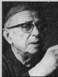
Jean-Paul Sartre (1905–1980)

Dostoievski a scris: „dacă Dumnezeu nu ar exista, totul ar fi permis”. Acesta este punctul de plecare al existențialismului. Într-adevăr, totul este permis dacă Dumnezeu nu există și, în consecință, omul este abandonat pentru că el nu găsește nici în sine, nici în afara sa vreă posibilitate de care să se agațe. El nu își mai poate găsi scuze. Dacă, într-adevăr, existența precedă esența, nu vom putea explica niciodată ceva prin referire la o natură dată sau fixată; cu alte cuvinte, nu există determinism, omul este liber, omul este libertatea. Pe de altă parte, dacă Dumnezeu nu există, noi nu găsim nicio valoare sau rânduială care să ne legitimeze comportamentul. Astăzi, nici în spatele nostru, nici în fața noastră, în domeniul luminos al valorilor, nu avem scuze sau justificări. Suntem singuri, fără scuze. Aceasta este ideea pe care voi încerca să o exprim când voi spune că omul este condamnat să fie liber.