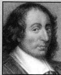
Blaise Pascal (1623–1662)

Imanent înseamnă ceea ce într-o ființă sau lucru, ține de un principiu sau de o cauzalitate internă și nu exterioară.